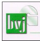
BUNDESVERBAND DER JUNGLASER UND FENSTERBAUER E.V., HADAMAR