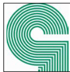
BUNDESINNUNGS- VERBAND DES GLASERHANDWERKS, HADAMAR